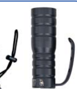
Bloc batterie 252P double autonomie