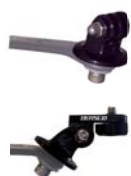
Kit GoPro ou Kit caméra sport