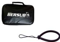
Sacoche de transport Dragonne