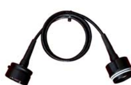
Connect-system permettant de transformer votre phare en système câblé pour la spéléo, montage photo...