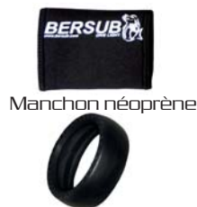
Manchon néoprène Bague de protection